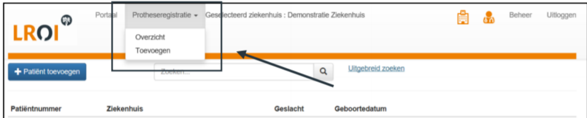
Afbeelding 1. Protheseregistratie